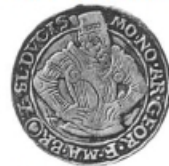
KRN44 – větší postava