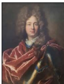
Maximilian Oldřich (Ulrich) Kaunitz

Kounicové (též Kaunicové či Kaunitzové) byli starý česko - moravský rytířský a později panský šlechtický rod. První zmínka pochází z 12. století. Tento starobylý moravský rod patří k rodinám užívajícím ve svém znaku symbol leknina, tj. dva stříbrné lekninové listy na červeném poli. Až v 16. století se Kounicové zařadili mezi významné pozemkové vlastníky na jižní Moravě, když v roce 1509 získali panství Slavkov u Brna, které poté bylo jejich hlavním sídlem přes 400 let. Dva synové Oldřicha z Kounic (†1617), který koncem 16. století přestavěl středověký slavkovský hrad na renesanční zámek. Roku 1608 se ve Slavkově uskutečnila schůze moravské šlechty, počínající odboj proti Rudolfovi II. Oldřich byl přesvědčeným zastáncem jednoty bratrské a ochráncem evangeliků. Stal se hlavou nekatolické šlechty, rod se poté rozdělil do dvou linií. Do moravské, později knížecí a do české hraběcí. Lev Vilém (1614 – 1655), zakladatel moravské linie, byl za zásluhy povýšen do hraběcího stavu. Jeho syn Dominik Ondřej (1654/1655 – 1705) se věnoval politické dráze a působil jako diplomat v habsburských službách Bavorsku, v Anglii, Holandsku a Belgii. Byl vyznamenán Řádem zlatého rouna. Za své zásluhy byl roku 1683 povýšen také do stavu říšských hrabat.