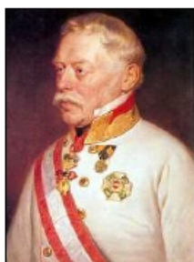
Jan Josef Václav Radecký

Ze čtvrté větve, kterou založil Kryštof, hejtman kouřimského kraje, je pro tuto publikaci nejdůležitější člen rodu Jan Josef Václav (1766 - 1858), slavný rakouský vojévůdce. Bojoval v napoleonských válkách, později se stal velitelem rakouské armády v Lombardii a Benátsku a s úspěchem ji zreorganizoval. Potlačil italské povstání v roce 1848 a i ve vysokém věku dokázal úspěšně velet armádě a vládnout i jako civilní velitel v celé severní Itálii. Zemřel po náhodném zranění při pádu. Jeho pohřeb se stal obrovskou manifestací rakouského vlastenectví. V roce 1858 byl v Praze na Malostranském náměstí vztyčen jeho pomník utlitý z ukořistěných italských děl, avšak po vzniku Československé republiky byl odstraněn. Za jeho života i po smrti bylo raženo mnoho pamětních medailí.