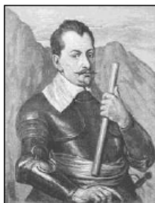
Albrecht z Valdštejna

Rod Valdštejnů patří k nejstarším českým panským a šlechtickým rodům u nás. Od roku 1758 používá rozšířené jméno po rodu svých zaniklým příbuzných, a to Valdštejnové – Vartenberkové.