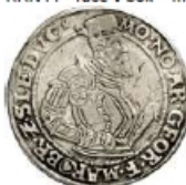
KRN45 – ruka s mečem