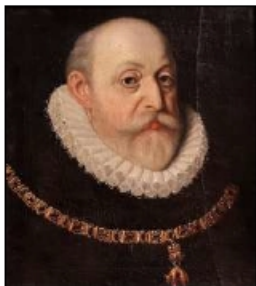
Vilém z Rožmberka

V roce 1422 obdržel za pomoc a věrné služby v dobách husitských Oldřich z Rožmberka od císaře Zikmunda Lucemburského právo razit mince. Není však znám ani druh či počet mincí ražených v té době, avšak měly být raženy v typech v zemi obvyklých. Toto právo ražby potvrdil i další král Jiří z Poděbrad v roce 1468 a po něm i Ferdinand I. Ten dne 7. července 1532 Joštovi a Petrovi udělil po dobu následujících 15 let právo razit české groše, bílé feniky a malé feniky o zákonné hmotnosti. Na ražbu měl dohlížet předem stanovený vardajn a mince měly obsahovat kromě značek vadajna a mincmistra také písmeno F na lící straně a znak rožmberků na rubové straně. Předpokládá se, že toto právo ražby zůstalo nevyužito, neboť z té doby nejsou známy žádné mince těchto rázů. Oldřich II. z Rožmberka (1403 - 1462) je jedním z nejznámějších členů rodu, který se však projevil spíše činy zapomělymi. Kromě různých zvláštních transakcí s nemovitým majetkem (třeba listivé připojení hradu Zvíkov) se hlavně podílel na vypracování listinného falsifikátu o původu rodu. Oldřich byl totiž ve styku s italskými renesančními dvory a právě italští hosté mu vnikli myšlénkou o italském původu pánů z Růž. Vymyslel a poté písemně zfalšifikoval pověst o původu Rožmberků ze starého římského rodu Ursini (latinsky medvěd) a jedním s italským rodem Orsini skutečně dosáhl oboustranně potvrzené dohody o tom, že tento smyšlený společný původ je pravdou. Z tohoto důvodu jsou některé z ražeb se společným erbem s rodem Orsini.