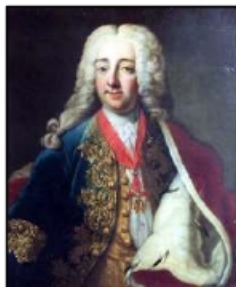
Jindřich kníže Auersperg

Johanův vnuk Jindřich (Heinrich) kníže Auersperg (1696 - 1783) pokračoval v ražbě mincí v mincovně ve Vídni, kde v roce 1762 byly jeho jménem raženy dukáty i tolary. Byl rytířem Řádu zlatého rouna a u císařského dvora zastával mnoho vysokých společenských, politických i vojenských funkcí. Díky dvěma sňatkům získal panství Červený Hrádek, Černou Horu a dědictví rodu Trautsonů se sídlem na zámku ve Vlašimi.