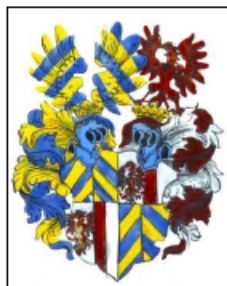
Erb Grypsků z Gryspachu