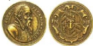
GRY15 – odlitek z 19. století