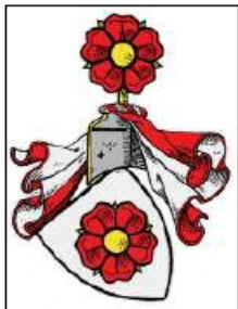
Erb pánů z Rožmberka