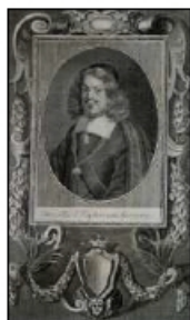
Jan Weikhard Auersperg

Auerspergové pocházejí ze Švábska a nejstarší doklady jsou údajně datovány rokem 1087. V 11. století se přestěhovali do Kraňska a jejich sídlem se stal hrad Auersperg, slovinsky Turjak. V 15. století se Pankráč II. a Volkard stali zakladateli dvou hlavních větví rodu. V 17. století se rod rozdělila na hraběcí a knížecí linii, do které byli někteří členové povýšeni. Rod Auerspergů je typickým monarchistickým šlechtickým rodem, který byl vždy loajální vládnoucím Habsburskům. U císařského dvora zastávali jak politické, tak i vojenské vysoké funkce. Do Čech přišli poměrně pozdě, ale i tady věmě hájili zájmy monarchie proti všem vlasteneckým snahám české šlechty i politiků. Auerspergové získali za svoji věmost od vládnoucích Habsburků mnohá vyznamenání a dosáhli významných vojenských, politických i společenských úspěchů. Již v 16. století byl slavným vojevůdcem Andreas (Ondřej) svobodný pán z Auerspergu (1556 - 1593) a proslavil se v bitvách proti Turkům. V 18. století se Auerspergové proslavili jako vojevůdci také proti Napoleonovi například v bitvě u Lipska. Rod se usadil v Čechách v polovině 18. století a získal zde mnoho hmotných statků. Patřilo jim m.j. panství Vlašim se zámkem, palác na Malé Straně, Slatiňany, Zelená hora a jiné. Také ve Slezsku jim patřilo vévodství minsterberské.