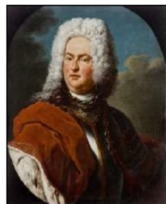
Jan Adam I. Ondřej Liechtenstein

Všechny mince ražené Karlem I. a Karlem Eusebiem můžeme považovat také za mince Opavského knížectví , které uvádíme na jiném místě této publikace, protože byly raženy v opavské mincovně a prioritně obíhaly na území Opavského knížectví. Další ražby Liechtensteinů bereme již jen jako dějinný seznam mincí a medailí tohoto rodu.