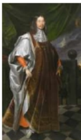
Jan Adolf I.

Adolfův syn Adam (1583 – 1641) se také věnoval vojenské činnosti, avšak za třicetileté války se jí aktivně neúčastnil. Jako jeden z mála nepracoval ve službách habsburských, ale pro braniborského kurfiřta. I přesto bylo hraběti Adamovi propůjčeno císařem Ferdinandem II. právo razit mince, které bylo dále strženo i Ferdinandem III. v roce 1638 pro panství Idstein a Gimborn.