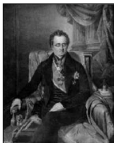
Antonín Bedřich I. Mitrovský

Mitrovští z Mitrovic a Nemyšle byl moravský šlechtický rod českého původu. Původně se psali s přívlastkem podle tvrze Nemyšle u Tábora v jižních Čechách a od 15. století podle Mitrovic u Písku. Až do 17. století patřili k nižší šlechtě v jižních Čechách. V době pobělohorské získali větší majetek a tím dosáhli vyššího postavení svojí loajalitou k Habsburkům. Česká větev rodu vymřela v roce 1737. Moravská větev dosáhla vyššího panského stavu v roce 1716 a obdržela hraběcí titulu v roce 1769.