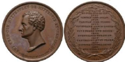
MIT01 - bronz