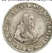
KRN44 – ruka s mečem