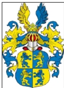
Erb pánů z Valdštejna