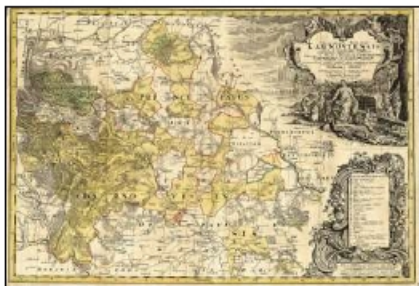
Mapa knížectví z roku 1736