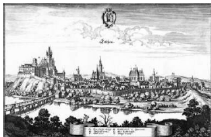
Rytina Těšina někdy kolem roku 1640

Těšínské knížectví ležící v Horním Slezsku vzniklo rozdělením Opolsko - Ratibořského knížectví mezi čtyři syny Vladislava I. Opolského po jeho smrti v roce 1281. Boleslav I. obdržel Opolsko, Kazimír Bytomsko a Měšek s Přemyslem se stali pány Ratibořska. To si v roce 1290 rozdělili tak, že Přemysl si ponechal Ratibořsko a Měšek se stal pánem zvlášť vyčleněného Těšínska – Osvětimské knížectví a za své sídlo si zvolil hrad Těšín. Tím se začal přiklánět k Českému království. Těšínsko mělo pro českého krále Václava II. strategický význam, neboť přes jeho území procházela cesta ke Krakovu. Již roku 1291 uzavřel s těšínským knížetem Měškem I. (1291 – 1314(5)) z rodu Piastovců dohodu, jež se svou povahou blížila lenímu svazku. Důležitostí jakou Těšínsko hrálo v plánech posledních Přemyslovců, se projevila také sňatkem Měškovy dcery Violy Těšínské s českým králem Václavem III.