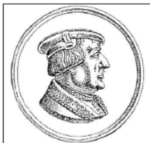
Jan IV. z Pernštejna

Pernštejnové jsou panským a šlechtickým rodem pocházejícím původně z jihozápadní Moravy. Největšího rozmachu dosáhli v 16. století, kdy patřili spolu s Rožmberky k nejmocnějším rodům České koruny. Rozšiřováním pozemkového majetku a rozumným hospodařením, se rod nakonec stal jedním ze tří nejbohatších v českých zemích. Rodu náležela rozsáhlá panství jak na Moravě, tak i v Čechách. Nebudeme se zde zabývat mnoha významnými členy tohoto rodu a zaměříme se na syna Viléma z Pernštejna, který se nejvíce zabýval ražbou mincí.