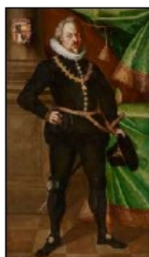
Karel I. Liechtenstein

První zmínka o jednom z nejstarších a nejbohatších rodů v Rakousku je z roku 1133. Nejstaršími přímými předkem je Dětiš zmiňovaný v letech 1178 – 1192. Rod měl své sídlo na hradě Liechtenstein u dolnorakouského Mödlingu a jeho členové se řadili k rakouským vévodům. Základem rodového pozemkového majetku byla panství Liechtenstein, Rohrau a Petronell. Tato dolnorakouská část rodu se ve 13. století rozdělila na tři linie. Dvě větve - Rohrau a Petronell vymřely již na počátku 14. století. Pokračující třetí rodovou linií jsou potomci Jindřicha I. (Heinricha I.) z Liechtensteina, který jakožto dolnorakouský šlechtic v roce 1249 získává od markraběte Přemysla do dědičného držení panství Mikulov se svým okolím (Lednice, Valtice, atd...), který se stal základem rozsáhlých majetků rodu na moravsko - rakouském pomezí. Příkladní se tehdy na Přemyslovu stranu ve sporu s jeho otcem králem Václavem I. Postupem doby se Liechtensteinové začlenili do politického života na Moravě a zastávali mnohé úřady. Rozdělili se na dvě větve – Mikulovskou a Valtickou.