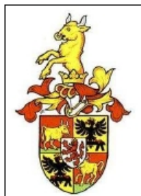
Pětipolý erb před rokem 1630

Auerspergové pocházejí ze Švábska a nejstarší doklady jsou údajně datovány rokem 1087. V 11. století se přestěhovali do Kraňska a jejich sídlem se stal hrad Auersperg, slovinsky Turjak. V 15. století se Pankráč II. a Volkard stali zakladateli dvou hlavních větví rodu. V 17. století se rod rozdělila na hraběcí a knížecí linii, do které byli někteří členové povýšeni. Rod Auerspergů je typickým monarchistickým šlechtickým rodem, který byl vždy loajální vládnoucím Habsburskům. U císařského dvora zastávali jak politické, tak i vojenské vysoké funkce. Do Čech přišli poměrně pozdě, ale i tady věmě hájili zájmy monarchie proti všem vlasteneckým snahám české šlechty i politiků. Auerspergové získali za svoji věmost od vládnoucích Habsburků mnohá vyznamenání a dosáhli významných vojenských, politických i společenských úspěchů. Již v 16. století byl slavným vojevůdcem Andreas (Ondřej) svobodný pán z Auerspergu (1556 - 1593) a proslavil se v bitvách proti Turkům. V 18. století se Auerspergové proslavili jako vojevůdci také proti Napoleonovi například v bitvě u Lipska. Rod se usadil v Čechách v polovině 18. století a získal zde mnoho hmotných statků. Patřilo jim m.j. panství Vlašim se zámkem, palác na Malé Straně, Slatiňany, Zelená hora a jiné. Také ve Slezsku jim patřilo vévodství minsterberské.