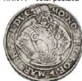
KRN45 – ruce v bok