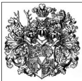
Erb větve Podstatský - Lichtenštejn

Podstatští z Prusinovic jsou starým moravským šlechtickým rodem. Patrně nejstarším předkem rodu byl Sezema z Prusinovic, který žil v polovině 14. století. Rod získal v roce 1408 panství Potštát u Přerova a od té doby se píše s přídomkem „z Prusinovic“. V 17. století se rod rozdělil do dvou hlavních linií. Hraběcí větve Podstatských z Lichtenšteina a baronské větve Podstatských z Prusinovic a Thonsemu. Po bělohorské porážce někteří z rodu ztratili díky konfiskacím svůj majetek a někteří naopak z habsburských konfiskací majetkové profitovali. Ztratili sice Potštát, ale získali například Bouzov, Ivanovice na Hané, Otrokovice, Zlín, Hustopeče nad Bečvou a jiné statky.