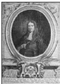
Bernard Ignác z Martinic

Starý český rod Martiniců je zaznamenán poprvé v roce 1322 a jeho původ je odvozen od vsi Martinice u Votic: Zde stojí také tvrz jménem Martinice. Markvart z Martinic koupil v letech 1416–1418 panství Smečno, které se pak na 500 let stalo hlavním rodovým sídlem. Rod později získal i další statky v Čechách, například tvrz ve Smečně, Benátky nad Jizerou, hrady Dražice či Okoř. Rozdělili se na dvě větve. Okořská vyznávala víru protestantskou, smečenská katolickou. Nejznámější člen rodu Jaroslav Bořita zdědil panství Smečno i Okoř a jakožto katolík byl příznivcem Habsburků.