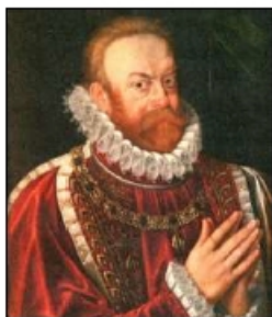
Vratislav II. z Pernštejna