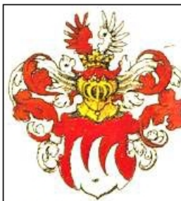
Erb Kinských z roku 1605