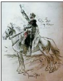
Jan Žižka z Trocnova

Žižkové z Trocnova byl starým českým vladýckým rodem. Svůj predikát odvozuje po tvrzi Trocnov v Jižních Čechách. První zmínky se datují někdy kolem roku 1350. Po husitských válkách jsou dějiny tohoto rodu nejasné.