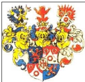
Erb rodu Schlicků

Do světových dějin peněžnictví se Šlikové zapsali vznikem výrazu dolar, který má původ v názvu jáchymovských tolarů ražených na jejich panství v Jáchymově v 16. století.