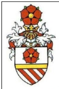
Erb Rožmberků s částí znaku rodu Orsini

Zakladatelem rodu je považován Vítek III. z Prčice a Plankenberka (1194 - 1236) ze známého rodu Vítkovců. Ti měli v erbovním znaku pětistloužňovou růži. Vítek měl doeru Anežku z Rožmberka a syny Zachariáše z Prčice, Vítko V. z Přiběnic a Voka I. z Rožmberka. Tento Vok I. kolem roku 1250 založil hrad Rožmberk, podle kterého se pak jeho rod jmenoval. Rod se poté rozdělil na pět větví, jenž všechny měly ve znaku růži. Původním sídlem krumlovské linie byl před rokem 1250 malý gotický Hrádek, dnes část zvaná Dolní hrad. Po vyměnění pánů z Krumlova v roce 1302 zdědili krumlovské panství příbuzní Rožmberkové, kteří jej drželi až do roku 1602.