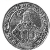
KRN44 – ruce v bok – menší postava