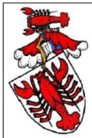
Erb Jana Žižky z Trocnova