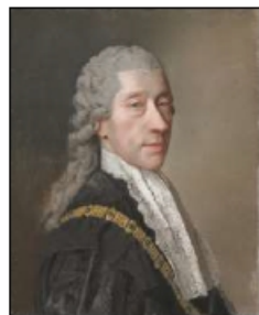
Václav Antonín Kaunitz