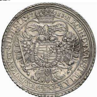
( - # 5a1ar " &'" Ag 28,545 g Wroclaw - , ' / 0 " * ' ' / 0