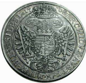
('# "4) 5alara "&' - Ag 14,12 g Wrocław