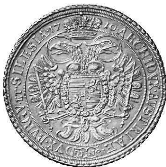
( &# 5a1ar " &'" Ag 28,545 g Wroclaw " ( ' ' / 0