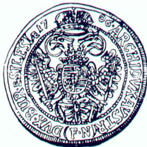
,.# "4) 5alara "&' ( Ag 14,12 g Wrocław