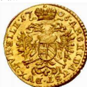
& " # " 4") 6ukata " & ' ( Au 0,28 g Wroclaw * , ' / 0