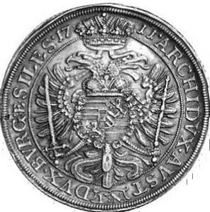
('# "4) 5alara "&' "" Ag 14,12 g Wrocław