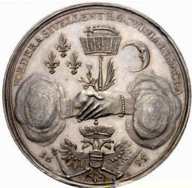
( . # " " 4) 5a1ara " ( . Ag 32,58 g Wroclaw Podpisanie pokoju z + ' ' ' / 0 & ' # " 4") 6ukata " & ' , Au 0,28 g Wroclaw Turcja w Karlowitz